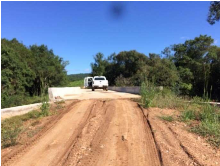
Ponte Cerro 21 concluída