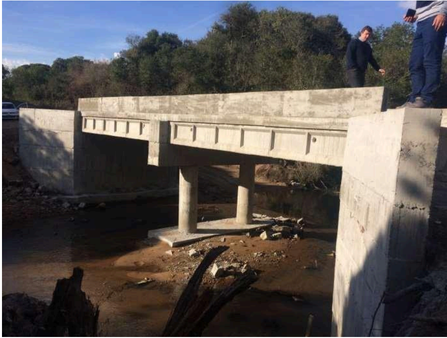
Ponte Passo do Canto