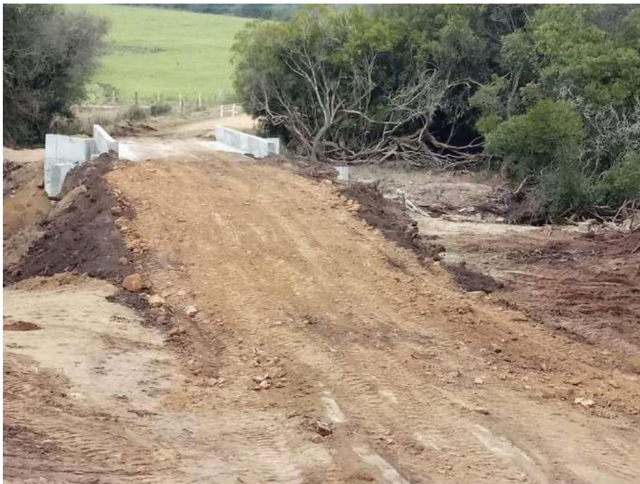
Ponte Passo do Canto concluída