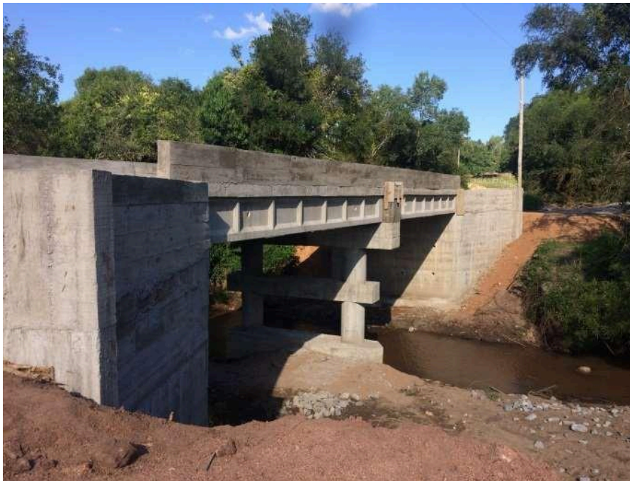
Estrutura finalizada Ponte Coxilha dos Cavalheiros