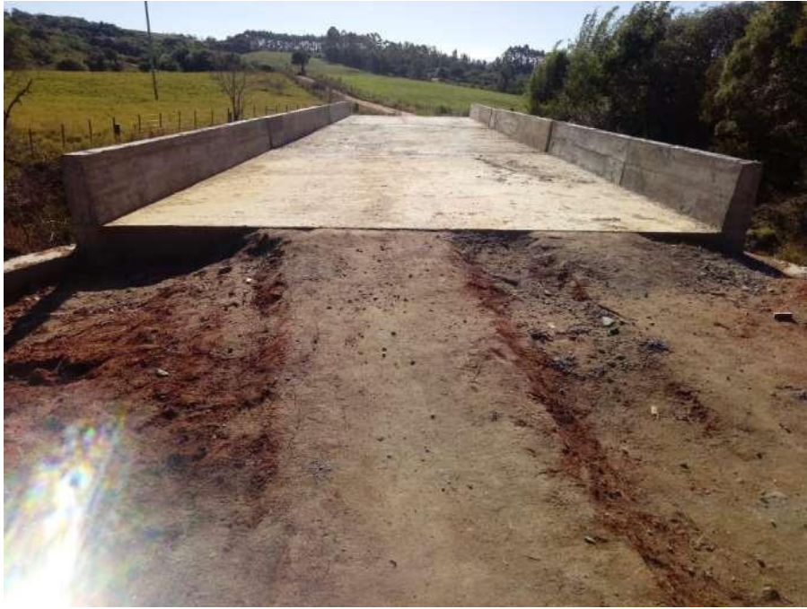
Conclusão da Obra, Ponte Rubens Tesmer