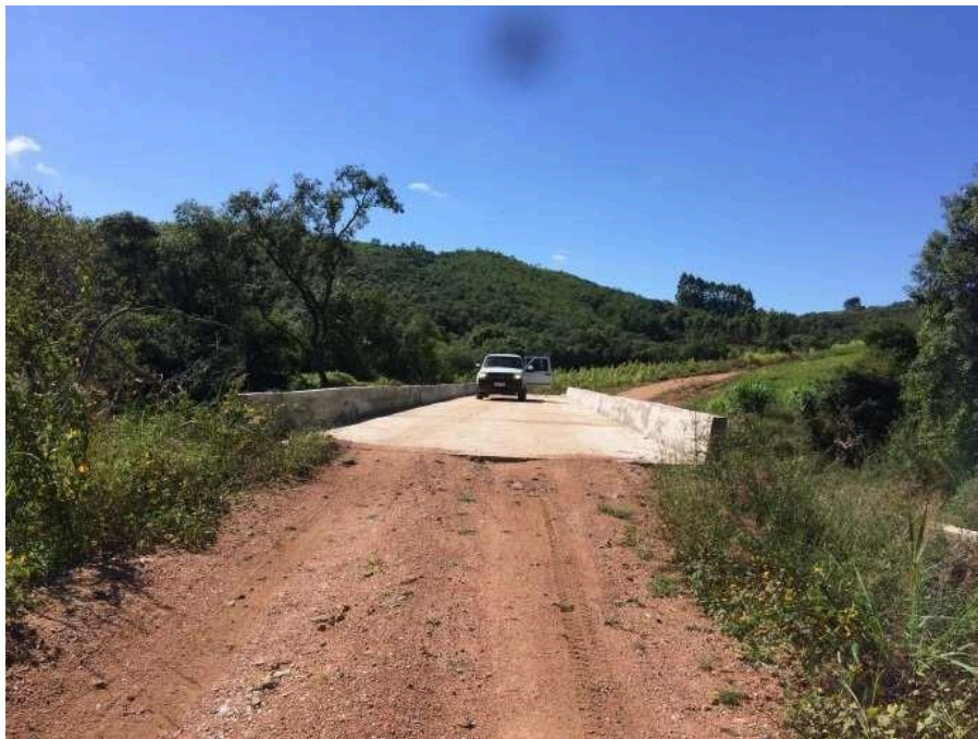
Ponte Florida/Potreiro Grande concluída