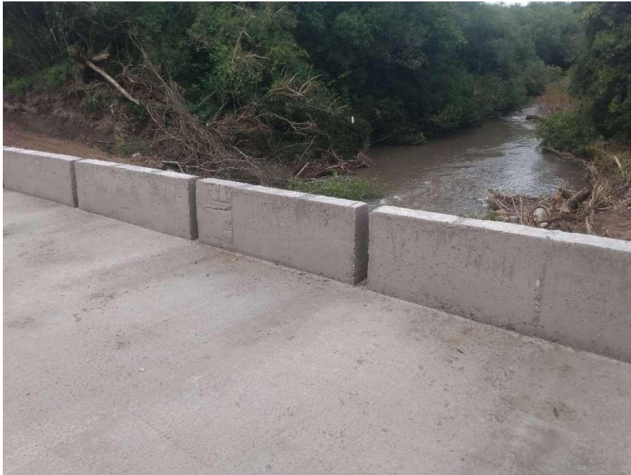
Conclusão da Ponte Passo do Saraiva