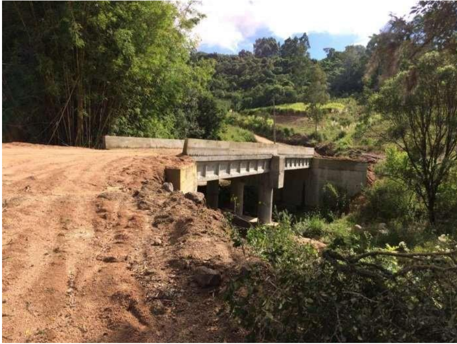
Ponte Santa Barbara concluída