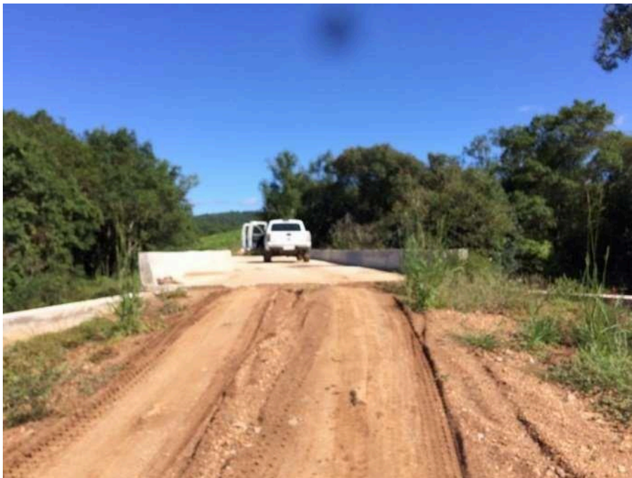
Ponte Cerro 21 concluída