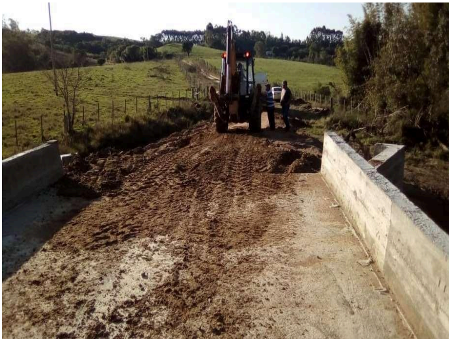
Conclusão dos aterros da Obra, Ponte Rubens Tesmer