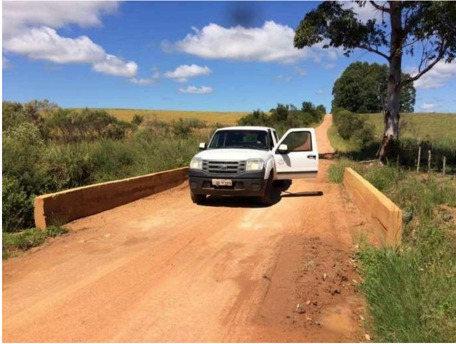
Ponte Assentamento Renascer concluída