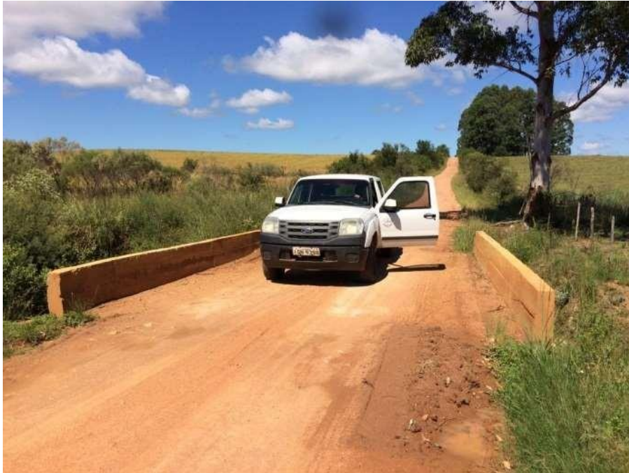
Ponte Assentamento Renascer concluída