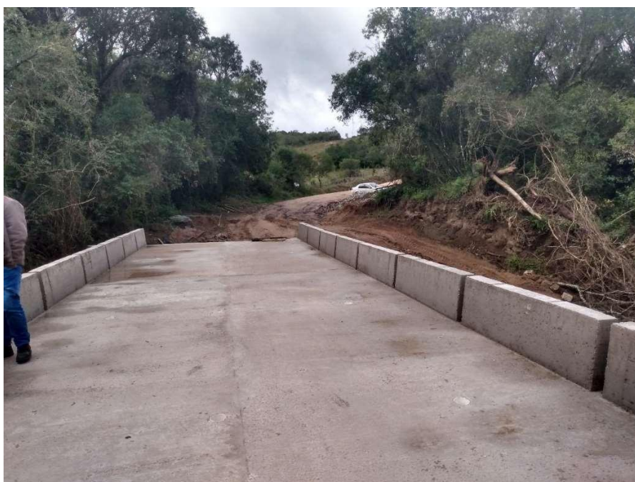
Conclusão da Ponte Passo do Saraiva