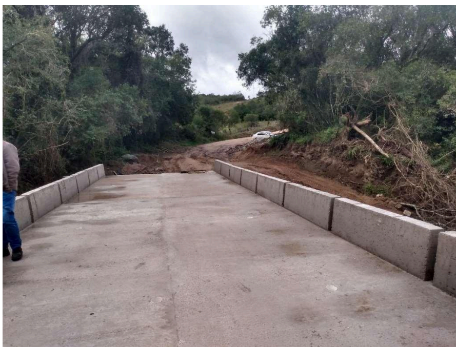
Conclusão da Ponte Passo do Saraiva