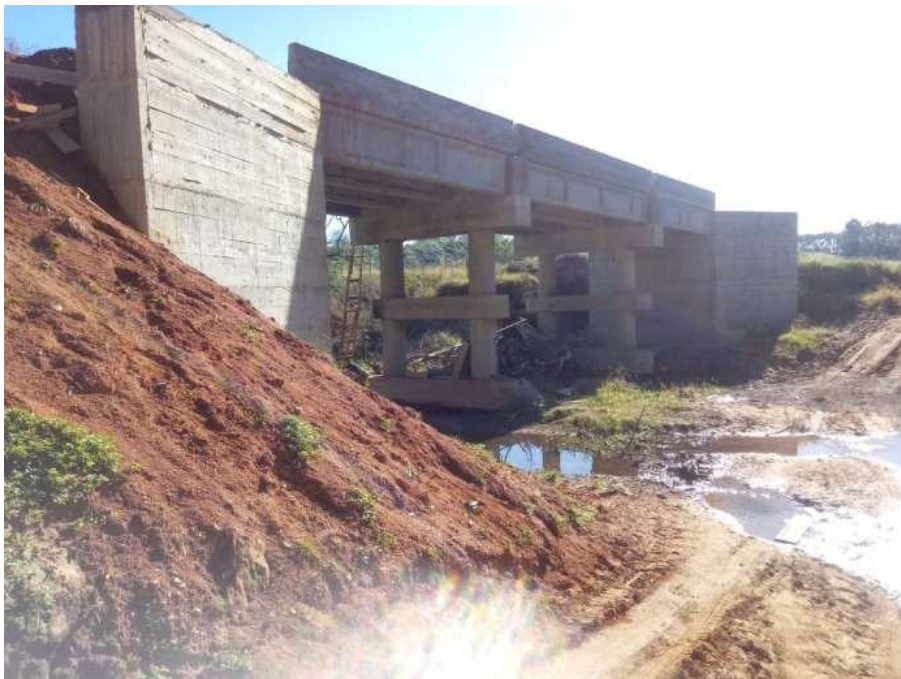
Conclusão da Obra, Ponte Rubens Tesmer