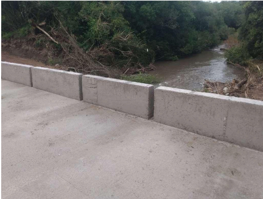
Conclusão da Ponte Passo do Saraiva