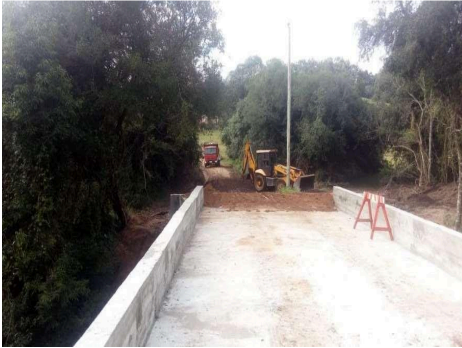
Conclusão da Ponte Coxilha dos Cavalheiros